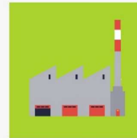
Společnosti a vlastnictví společností