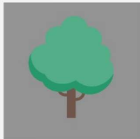
Pozorování Země a životní prostředí